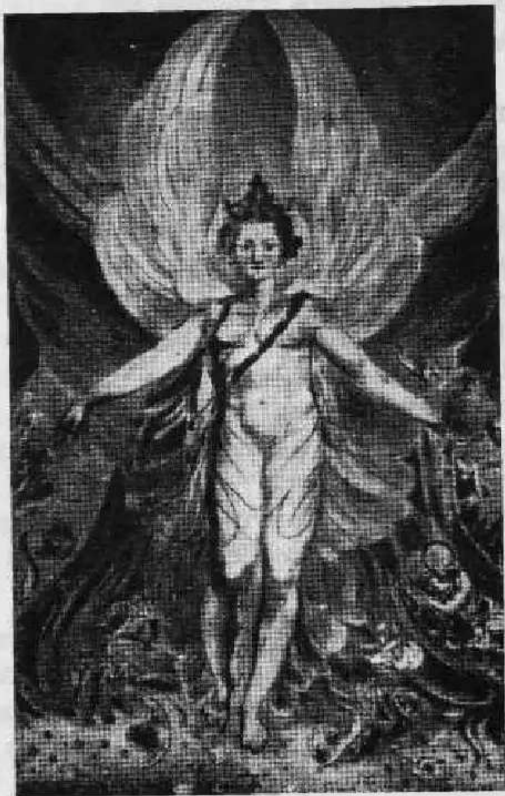
Satã em sua glória original Pintura de Blake

O culto de Satã, que é invariavelmente representado pela serpente, nasceu talvez, da ofilatria dos atlantes, daí passando para outras lendas e estórias. Entre os semitas era chamado de "o Inimigo", entre os muçulmanos era XAITÃ, entre os mexicanos XATÃ. Blake afirmava tê-lo visto da forma acima. Outros viram-no com chifres e tridentes.