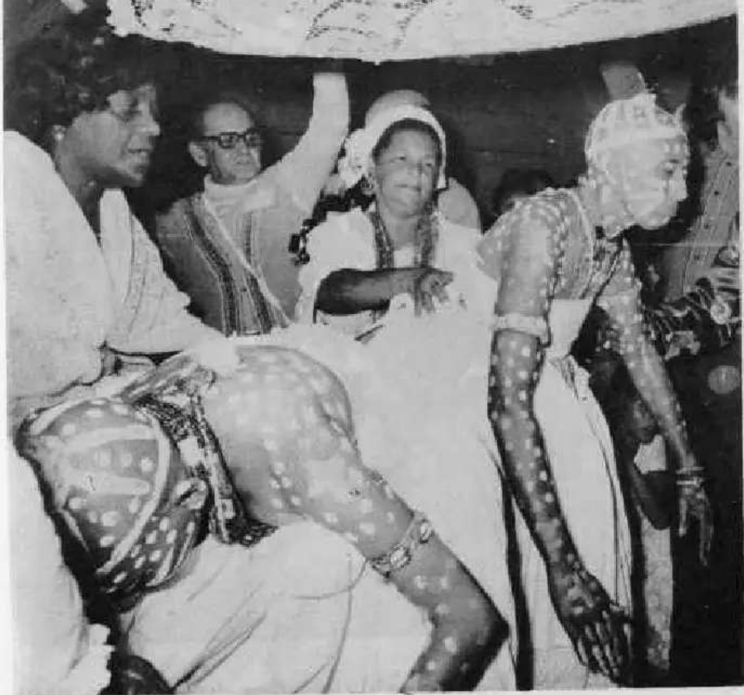
Iaôs pintadas na primeira saída da camarinha

sete anos de santo o decá é uma cuia, e uns apetrechos usados no ritual, não é um diploma como vi no Rio. Candomblé não tem diploma.