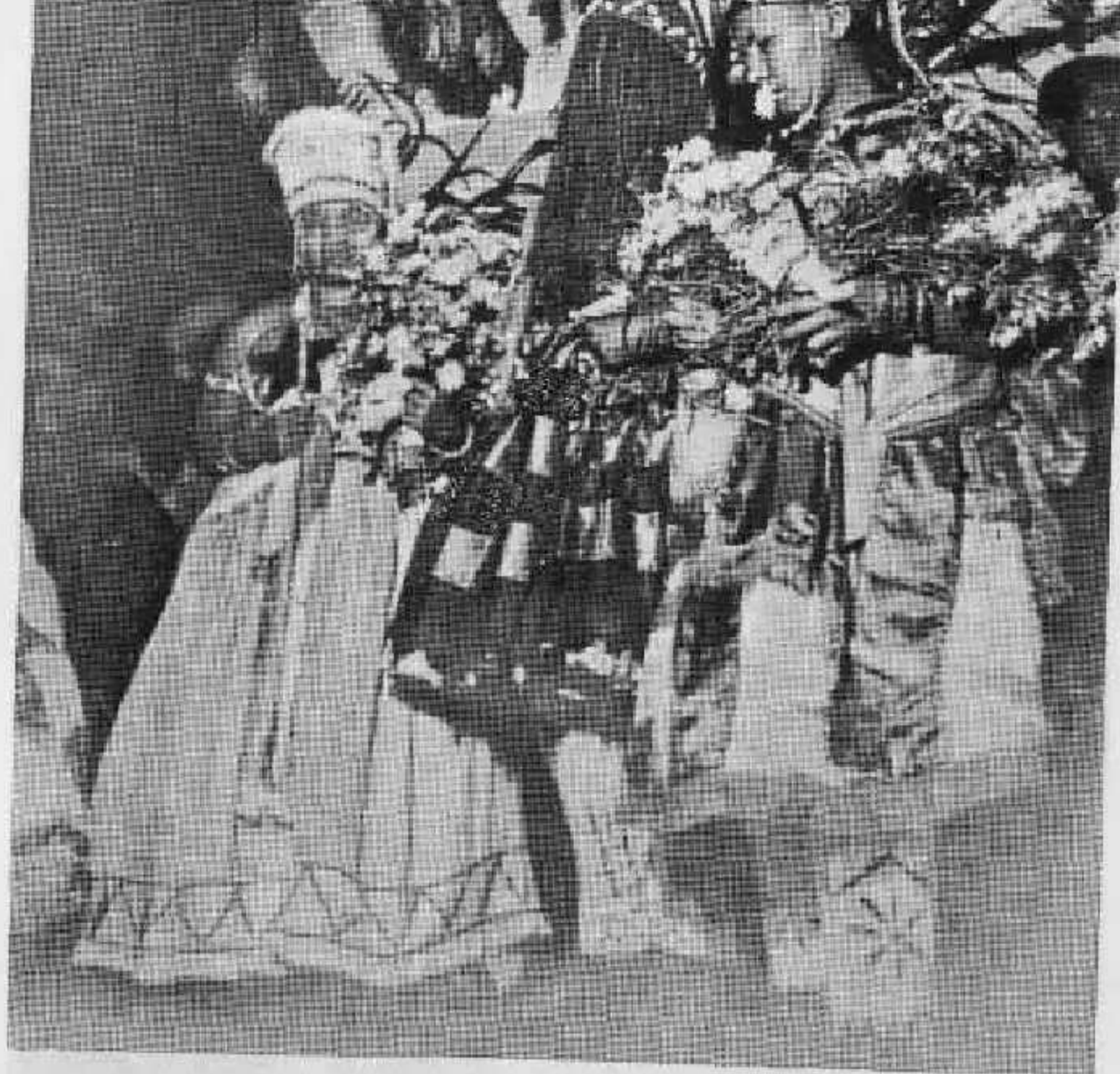
Iemanjá, Omulu e Oxossi, na última fase da Iniciação nagô, quando mostram-se ao público, incorporados em suas iaôs, trazendo suas roupas e ferramentas.

Sentei-me ao lado do pai de santo e observei o seguinte: