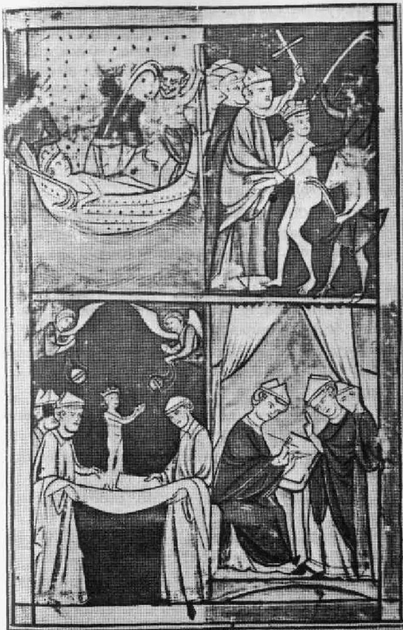
Rei Dagoberto sendo levado por demos sobre a Estige. E sendo reconhecido pelos anjos bons é ajudado. Lembranças da feitiçaria eutopéia.