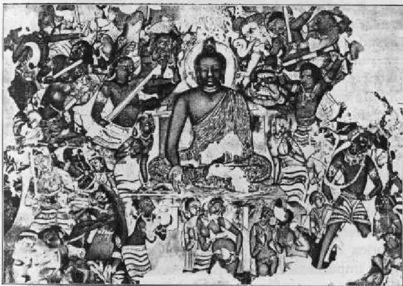
Ajanta. Pintura mural. Las tentaciones de Buda (AJANTA)

O mais temido demônio da Arábia foi DJANN — o perverso.