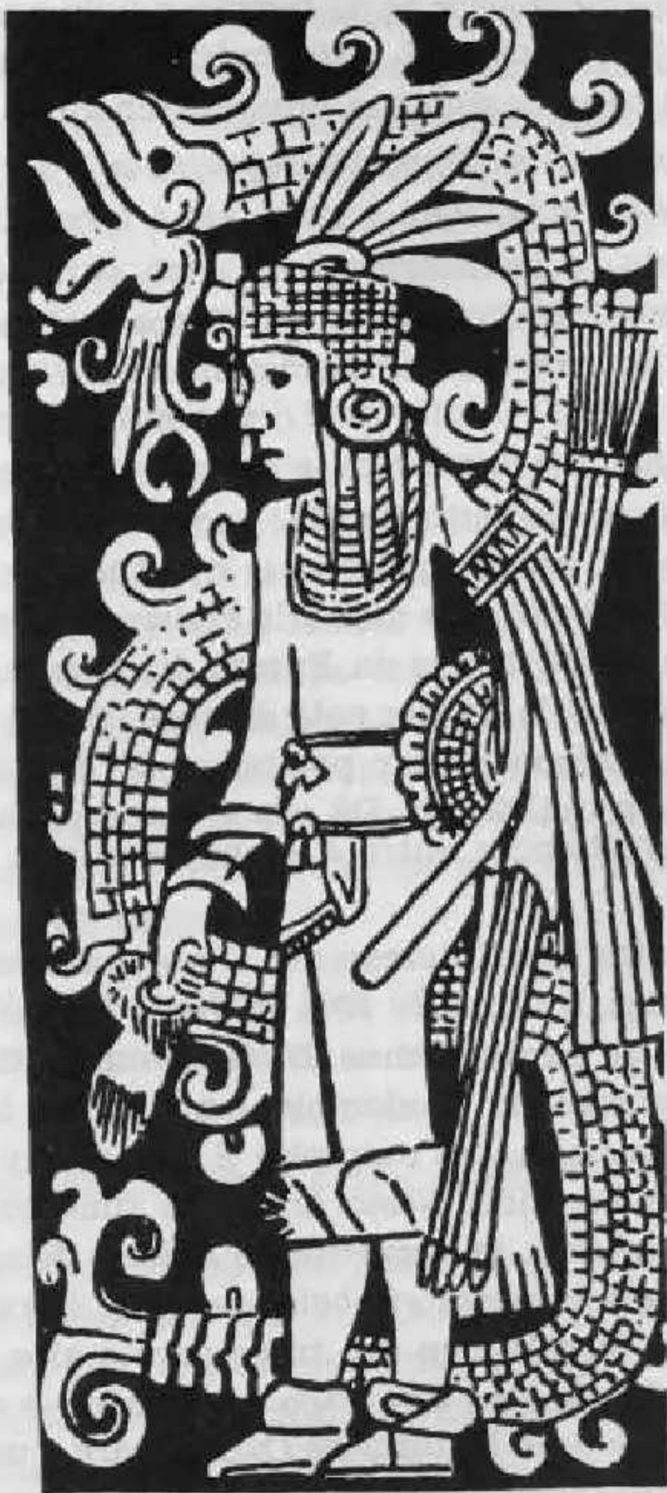
Quetzalcoatl, serpente com asas. A serpente emplumada da religião mais era na verdade um demônio muito cuidadoso, diziam os indígenas da região. Ele só aparecia de noite e exigia cobras, gordura e sangue para satisfazer-se.