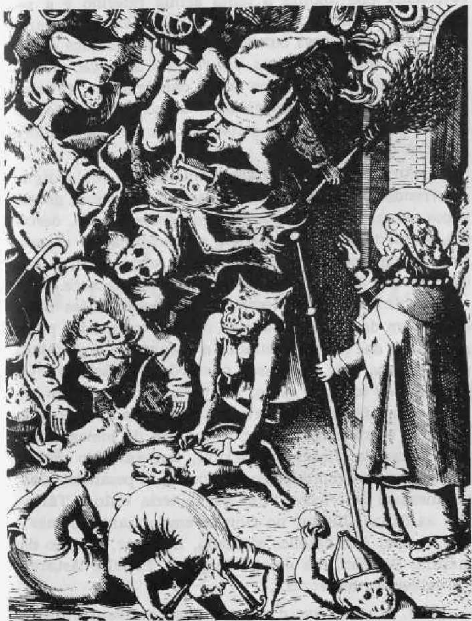
São Nicolau entrando no Inferno, numa visão medieval.